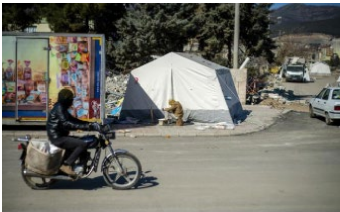
사진 2. 수천 명의 이재민이 계속되는 추위에 직면해 있음.