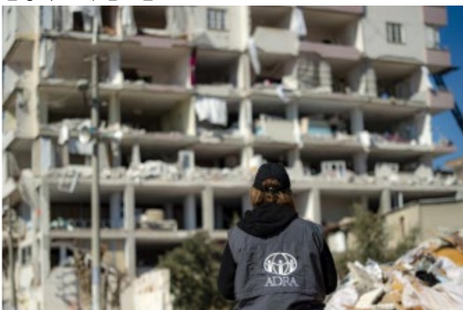
사진 4. 24시간 내내 쉬지 않고 누르다이(Nurdaği)에서 인명 구조에 힘쓰는 ADRA ERT